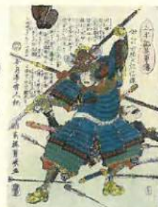
「太平記英秀佐 伊計田勝三郎信輝」(鳥取市歴史博物館蔵)

鳥取市歴史博物館が収集した資料を中心に、江戸時代から明治時代の錦絵の数々を紹介いたします。