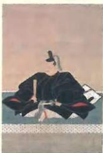
「吉川元春像」(吉川史料館蔵)

鳥取市と岩国市を結び、天正9年(1581)の鳥取城攻めと吉川経家を紹介すると共に、吉川史料館が所蔵する吉川家伝来の名品の数々を紹介いたします。